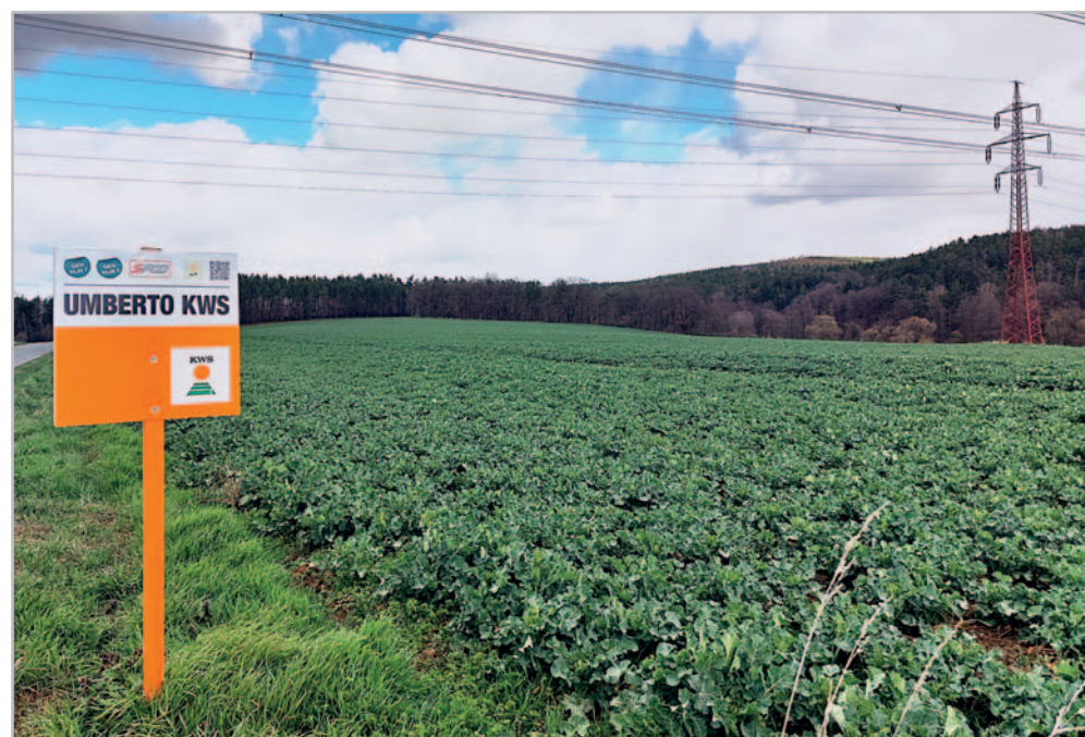
KWS Umberto na počátku března, Plzeňsko

KWS je zdravotní stav podpořen o geneticky podmíněnou odolnost vůči Phoma (gen RLM 7 a RLM 3), dále se vyznačuje nadprůměrnou odolností vůči Verticillium či Sclerotinia . Umberto KWS je adaptabilním hybridem, vhodným jak do teplých, tak chladných lokalit. Vyniká rychlým počátečním startem a bujným podzimním růstem. Je tak vhodný i pro pozdější termíny setí. Silnější rostliny jsou také podstatnou výhodou v boji proti dřepčíku olejkovému, a to jak proti žiru dospělce, tak následně proti jeho larvám. Velmi dobře reaguje na vyšší intenzitu pěstování, kde je možno využít naplno jeho vysokého potenciálu. Je vybaven funkcí S-POD, kde bylo v rámci šlechtění na základě zpevnění a zkrácení lamel na šesuli docíleno vysoké odolnosti vůči pukání šesulí při dosažení sklizňové zralosti. Šesule odrůd KWS vybavené touto funkcí také