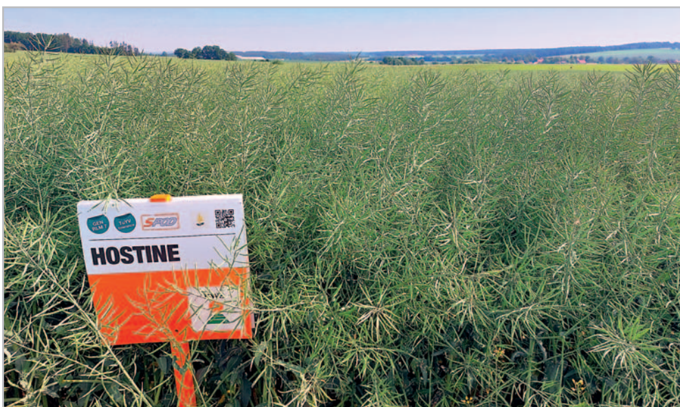
Hostine, Jižní Čechy