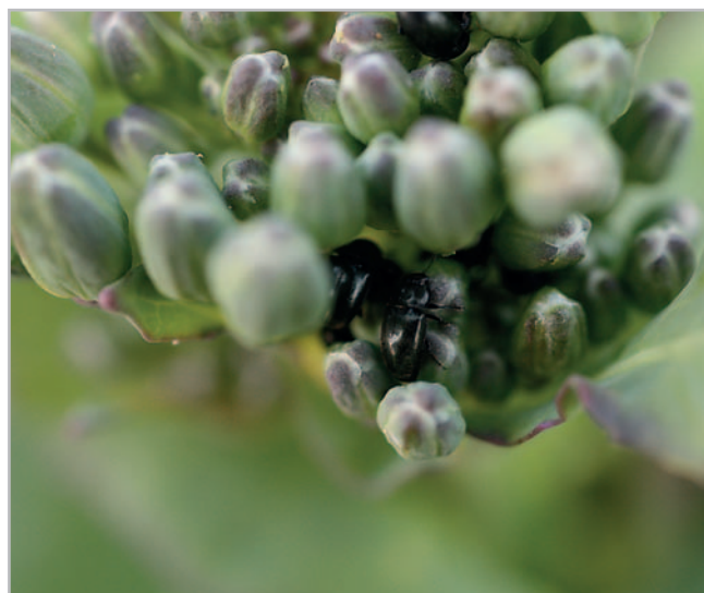
Ozimá řepka – KWS SAAT SE &amp; Co. KGaA

Hostine dosahuje i vysoké úrody semen – dokázal to i v registračních zkouškách ÚKSUP, ve kte-