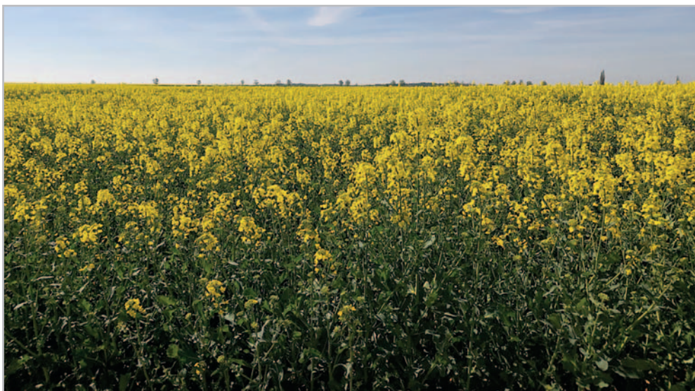
Hostine, lokalita Písek (okres Hradec Králové)

rých byl 5. nejúrodnější odrůdou za průměr let 2019–2020. Těchto skvělých výsledků dosáhl v tvrdé konkurenci nejnovějších odrůd konkurenčních společností, přičemž jeho průměrná úroda byla 5,1 /ha. Schopnost dosahovat vysoké úrody potvrdila i 4. nejvyšší úroda v provozních pokusech