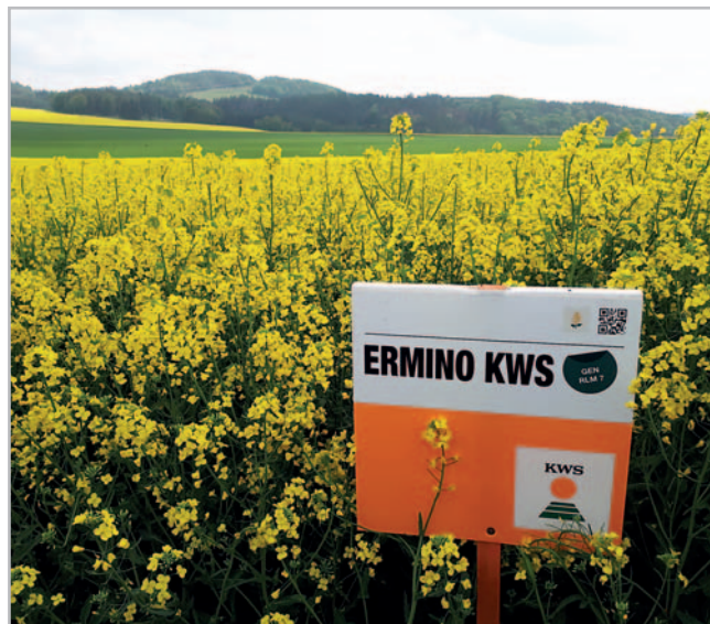
Ermino KWS v květu

Ermino KWS se chová v mnoha směrech jako klasický hybrid. Doporučujeme střední až pozdní termín setí z důvodu rychlého vývoje na podzim. Ermino KWS velmi dobře přeží-