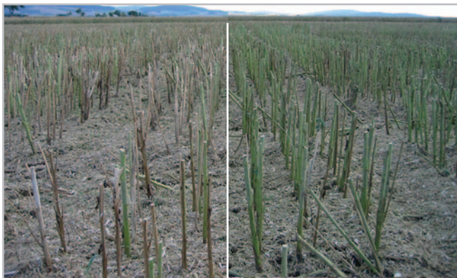
Rozdíl ve výskytu chorob stonků u řepky po sklizni

Také napoví prezentované výsledky v on-line seminářích, novinách, časopisech a v neposlední řadě na webových stránkách jednotlivých firem.