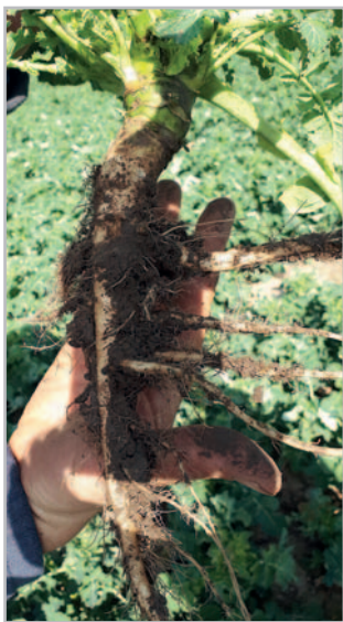
Silný a zdravý kořen hybridu Marc KWS

A tak bude rozhodovat nejen zkušenost s danou odrůdou, ale i zkušenost ostatních zemědělců.