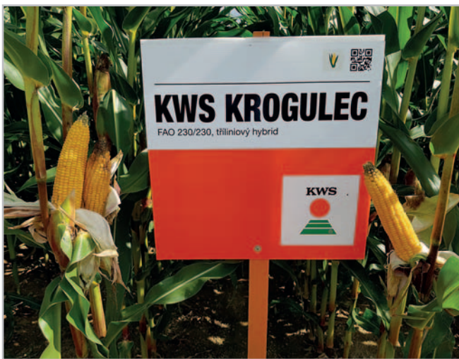
KWS Krogulec

KWS Akustika je dvouliniovým zrnovým hybridem určeným pro kukuřičnou výrobní oblast a nejteplejší oblasti v řepařském výrobním typu. Jde o typický hybrid s FAO 340 a typem zrna koňský zub, který vyniká rychlým uvolňováním vody ze zrna, a tak je možné dosahovat velmi příznivé ekonomiky pěstování. KWS Akustika kromě velmi rychlého uvolnění vody ze zrna dosahuje i extrémně vysokých výnosů zrna, a to hlavně v letech, které jsou méně příznivé pro růst a vývoj kukuřice (suché ročníky).