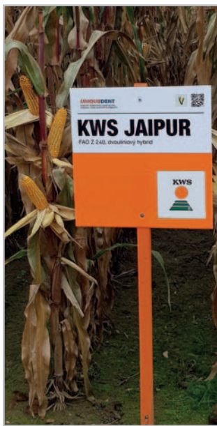
KWS Jaipur

KWS Krogulec je tříliniový plastický univerzální hybrid s rovnoměrně dozrávajícím zbytkem rostliny s FAO 230, což ho řadí mezi velmi rané odrůdy vhodné do nadmořských výšek mezi 450 až 550 metrů, kde je schopný nejlépe zúročit svůj genetický potenciál. KWS Krogulec se vyznačuje tvrdým typem zrna, které je velmi dobře využíváno pro mlynářské účely (tak jako dříve pěstitelé využívaly a mlynáři oblíbený hybrid Ricardinio). KWS Krogulec byl zaregistrován na ÚKZÚZ v roce 2019 (po zkoušení v letech 2017 a 2018).