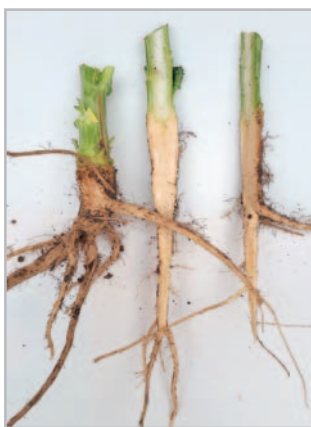
Zdravý, silný kořen, duben 2020

rovnoměrně, což je velkou výhodou při sklizni, a zároveň jedním z hlavních předpokladů pro bezpečnou a bezztrátovou sklizeň. Navíc tento hybrid disponuje S-POD funkcí, která představuje geneticky podmíněnou odolnost vůči pukání šešulí ke konci zrání,