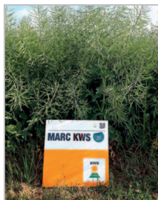
Bohatě navětvěné rostliny Marc KWS, květen 2019

Dalo by se tedy říct, že vykazuje špičkovou odolnost vůči celému komplexu pro řepku významných chorob.