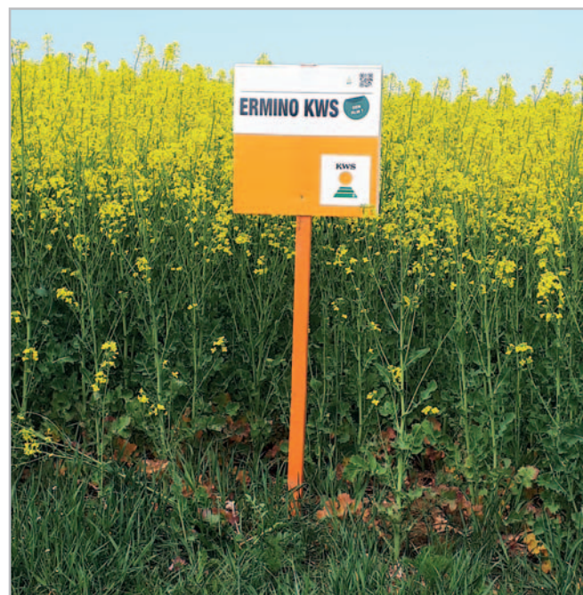
Vítání rostlina hybridu řepky Ermino KWS

nosti KWS, které jsou zakládány na stanovištích ve všech klimatických oblastech ČR, se ve výnosu pohybuje Ermino KWS vždy mezi prvními spolu s hybridem Umberto KWS a Marc KWS (viz graf).