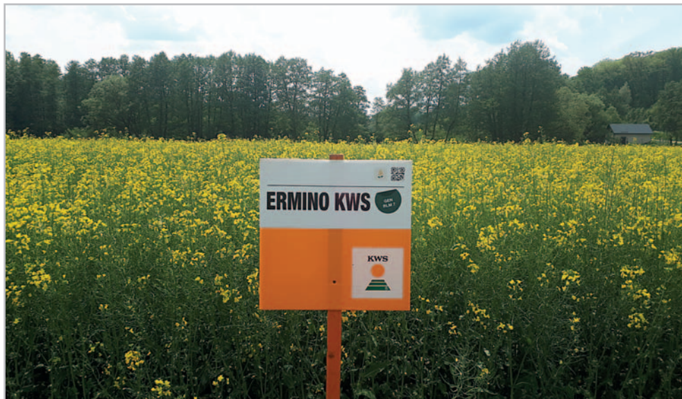
Rozkvetlé pole s hybridem řepky Ermino KWS

značku ATAWAC. Je to zkratka tří anglických slov, Any Time – kdykoli, Any Where – kdekoli, Any Condition – v jakýchkoliv podmínkách. Který hybrid by o tuto značku nestál a který pěstitel by nestál o tento hybrid? Hybrid ozimé řepky Ermino KWS těmto požadavkům plně vyhovuje. V České republice byl registrován v roce 2016 po velmi úspěšném uznávacím řízení v pokusech ÚKZÚZ, kdy ve zkušebních letech 2014–2016 měl průměrný výnos 6,26 t/ha. Neméně úspěšný je i v SDO. V letech 2017–2019 byl hybrid Ermino KWS v pokusech SDO ÚKZÚZ zkoušen jak v teplé, tak chladné oblasti. V obou si vedl znamenitě. V TO i CHO dosáhl 112 % na průměr pokusu. V poloprovozních pokusech společ-