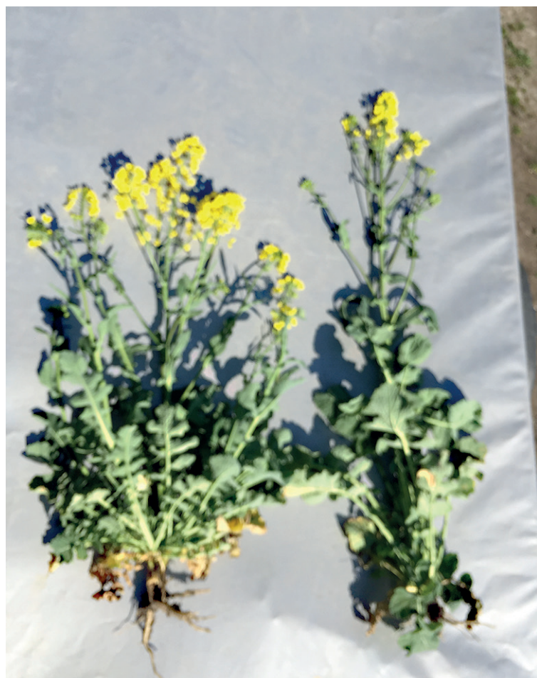
Hybrid Allberich KWS (nalevo) dokazuje, že 3/4 z výšky rostliny tvoří patro květů.

ku. Jeho předností je opět rychlý podzimní start a vynikající přežimování. Jaro má pozvolnější, ale ve zrání a sklizni je ze všech nabízených řepok KWS nejrychlejší.