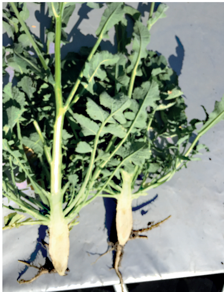
Silný kořenový krček a zdravá rostlina jsou základem vysoké odolnosti proti poléhání.

Na rozdíl od dvou předešlých hybridů je vhodný pro pěstování ve všech polohách vhodných pro řep-